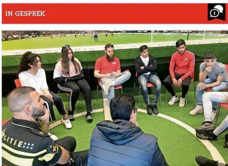
Jongeren met elkaar in gesprek over de gevolgen van crimineel gedrag.

Voorbeeld van een BuurtBijdrage in het kader van de Futsal BuurtBattle: